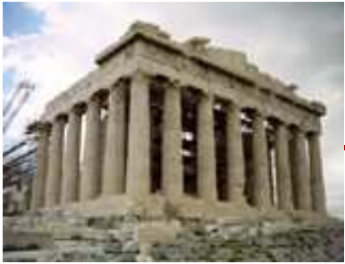
TICE & Piliers 1, 4 et 5 du socle